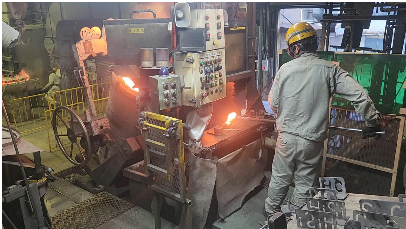
機械統括部（日進工場・熊本工場）での作業風景