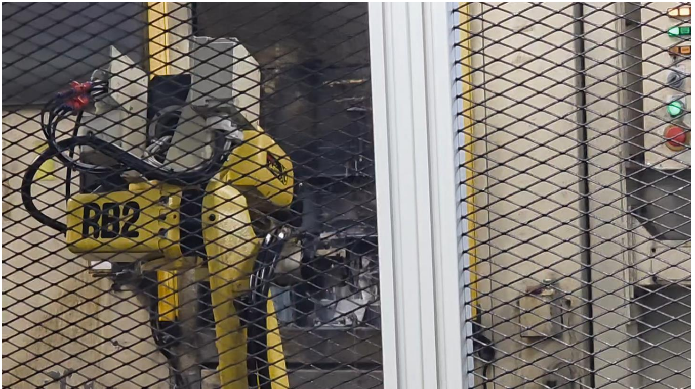
鑄造統括部（岐阜久尻工場）での作業風景