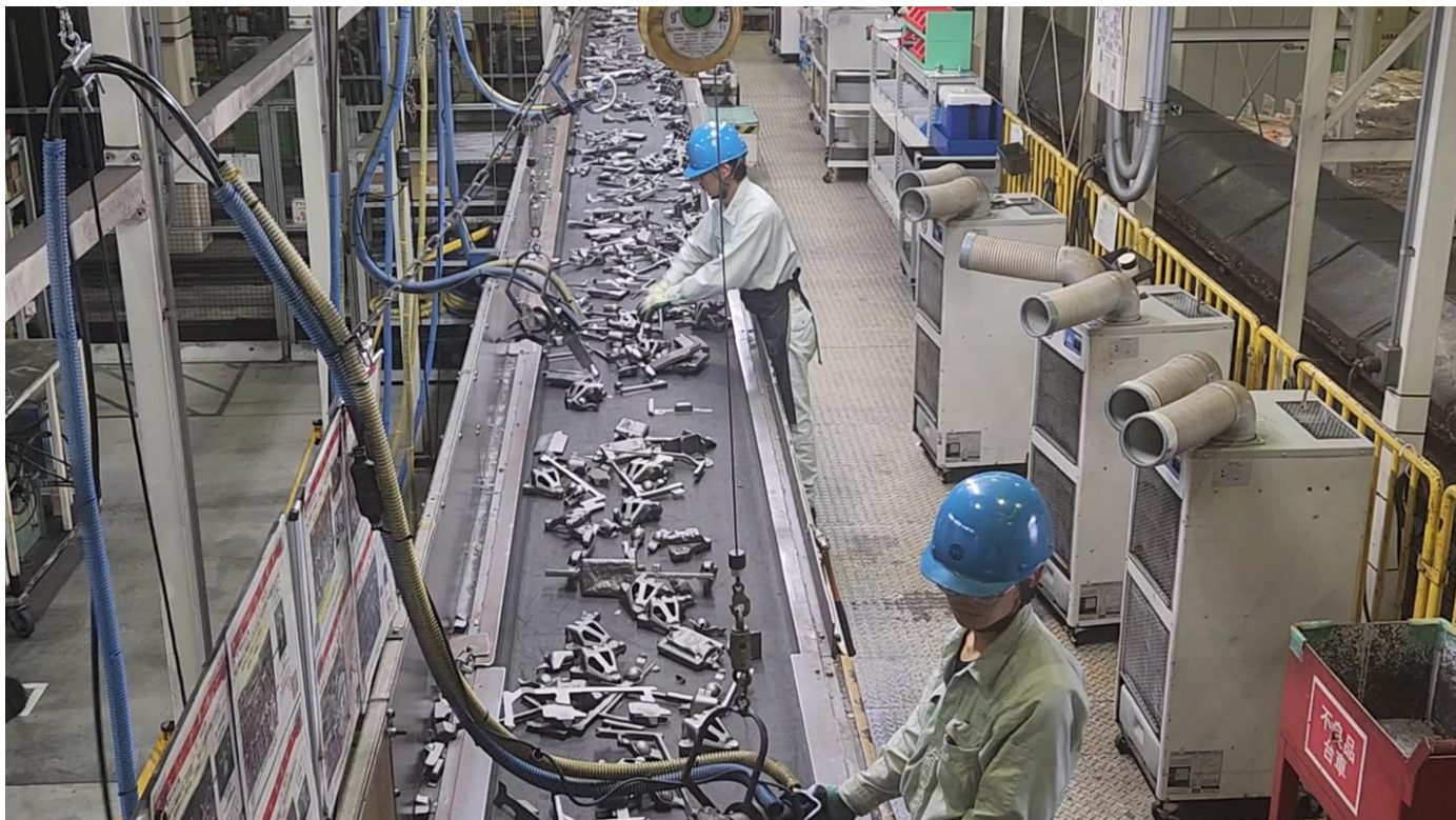
鑄造統括部（岐阜久尻工場）での作業風景